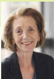
Nicole BRICQ Ministre du Commerce extérieur

« A l'heure où la création d'emplois repose notamment sur la capacité des entreprises françaises à gagner des marchés à l'étranger et à s'affirmer