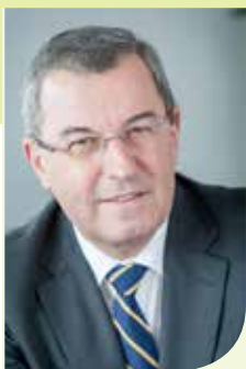
Jean-Paul BACQUET Président d'UBIFRANCE